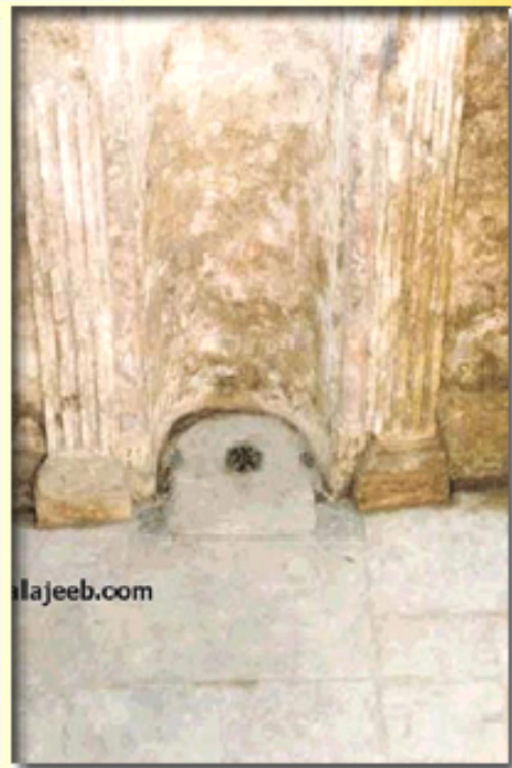
نۆرێزگەهێ پێخە مەبەرێ خوای سەلامی خوای لەسەر بێت